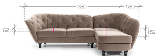
narożnik > corner sofa 3L+OP 1. paczka | package - OP - 185x120x70 cm (1,55m 3 , 38,5kg) 2. paczka | package - 3L - 170x90x70 cm (1,07m 3 , 35,5kg)